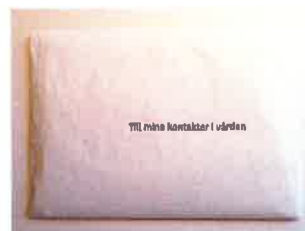
Brev till vårdkontakten

Efter kommentarer kring "Conference-approved literature" från representanter i central service har jag, Johan Ö, valt att söka i vår stora bas av erfarenhet i AA. GSO har tagit fram ett "Service Material" i ämnet (sök efter SM F-29 på aa.org) och detta har varit till stor hjälp i våra diskussioner i Västra regionen. Materialet är översatt och kommer att finnas på OI-forum, och ett utdrag lyder som följer: